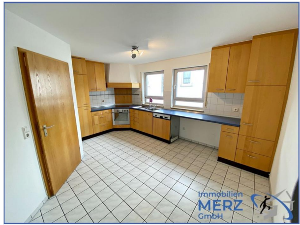
Immobilien MERZ Rottenburg-Tübingen (2)