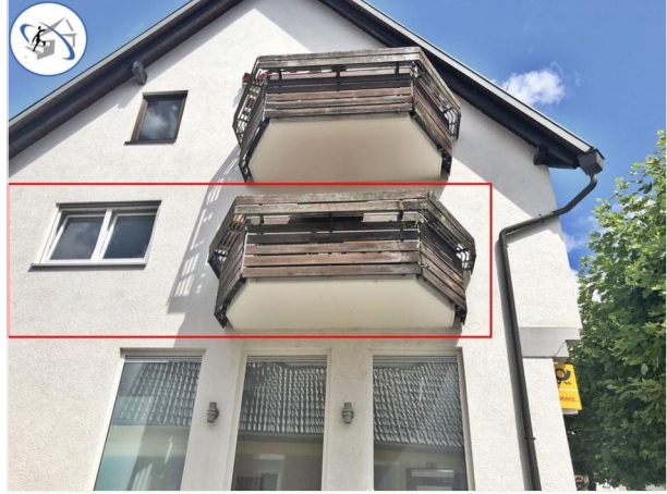
Immobilien MERZ GmbH Rottenburg + Tübingen (