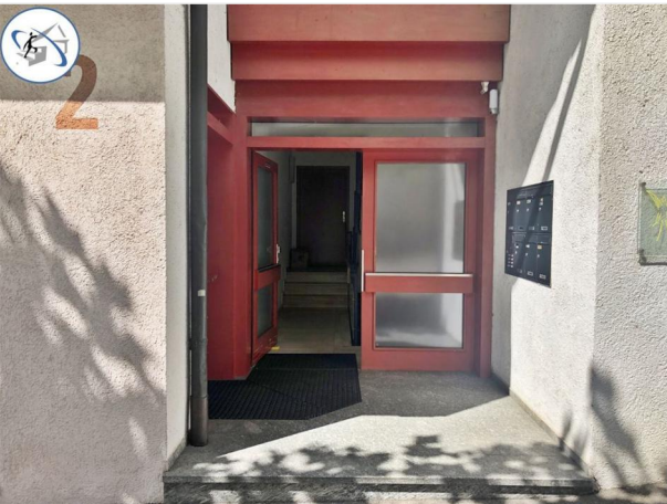
Immobilien MERZ GmbH Rottenburg + Tübingen (