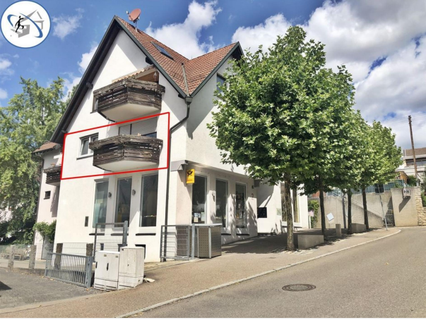
Immobilien MERZ GmbH Rottenburg + Tübingen (